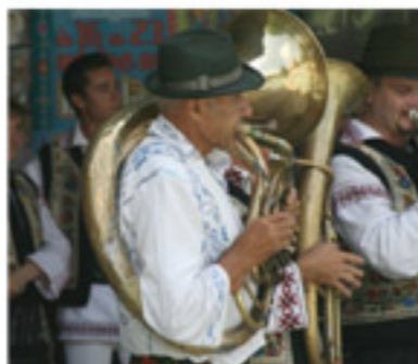
L'ensemble folklorique VORONA