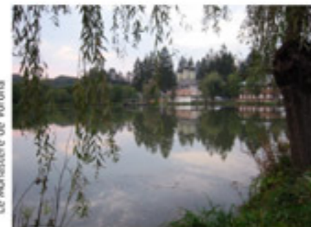
Le Monastère de Vorona