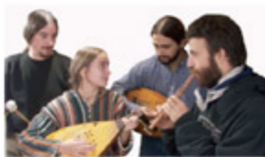
Le groupe Trei Parale