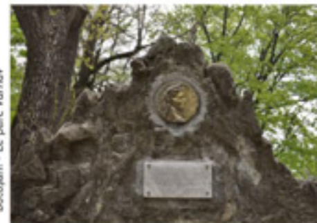
Botosani - Le parc Vornov

• Visite de la ville de DOROHOI, de la Maison Mémoire George Enescu, du Monastère de Braiesti, de la ville de DARABANI.